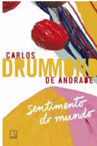
Sentimento do mundo-Carlos Drummond de Andrade - 1º tri