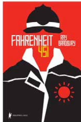
Fahrenheit 451 - 2º tri