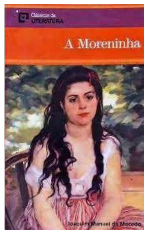
A moreninha - 3º tri