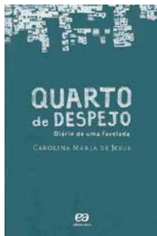
O quarto de despejo - 3º tri