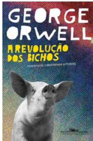
A Revolução dos Bichos - 1º tri