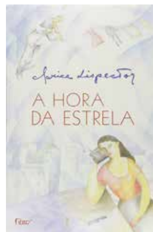
A hora da estrela- Clarice Lispector - 3º tri