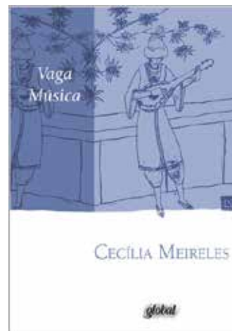
Vaga Música, de Cecília Meireles - 2º tri