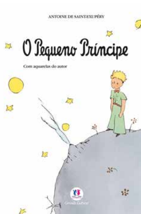
Pequeno príncipe - 2º tri