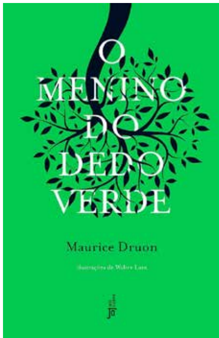
O menino do dedo verde - 1º tri