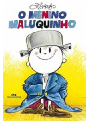
Menino Maluquinho - 2º tri