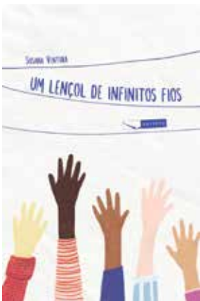
Um lençol de infinito fios - 1º tri